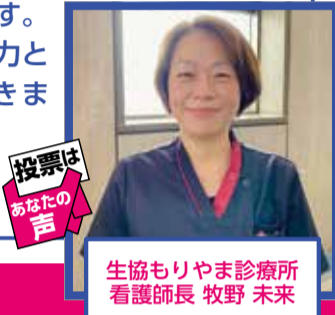
投票はあなたの声