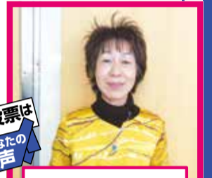
投票はあなたの声

コロナ禍で不安定な開催だった“にじっこ”もやっと落ち着いて、ほっと一息。子どもたちの元気な姿、あどけない動作に喜びを感じるこの頃です。私はお母さんたちが一人ぼっちで悩まずに子育てが出来るように、子どもたちがいっぱい遊び、すくすく成長していけるようにとの思いで、“にじっこ”を楽しんできました。私は子どもたちが未来に夢と希望がもてる社会を願っています。すべてを壊す戦争だけはあってはならないと思います。どんな社会を子どもたちにつくってあげられるか？…ぜひ、選挙に行ってくださいね！！子どもたちの幸せのために！