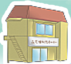
北訪問看護ステーション (訪問看護) (居宅介護支援)