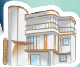
生協もりやま 診療所