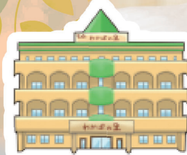
生協わかばの里 (老人保健施設)