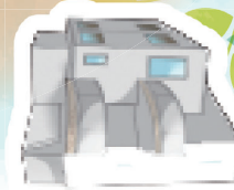
西区くらしのセンター (通所介護)