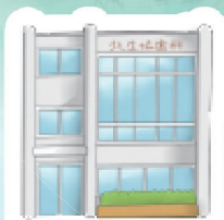
すまいるハートビル (歯科) (メンタルクリニック)