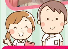
糖尿病看護の学習会